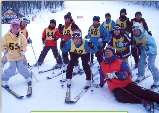
昨年参加の子供たち