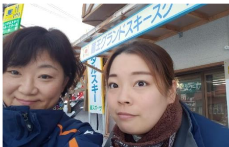
蔵王グランドスキーのスタッフ