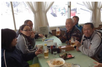
大会のサポート??笑